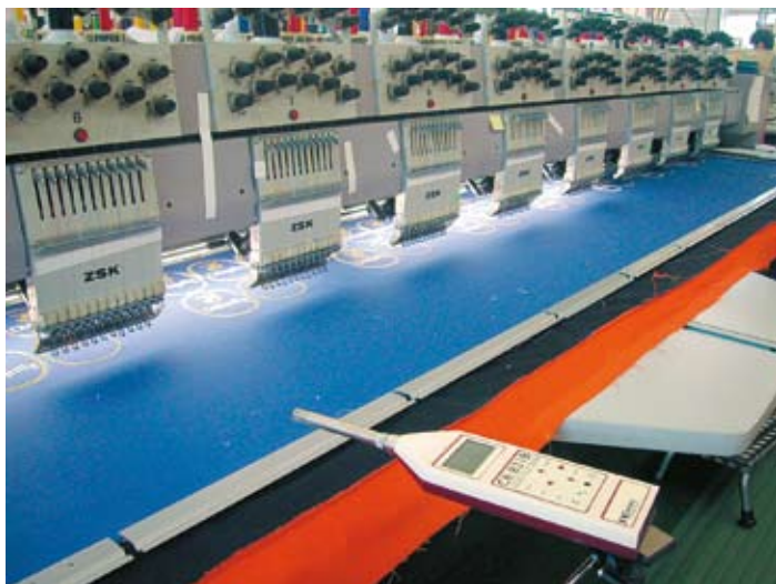
Der Universal-Schallpegelmesser CR:821B von Cirrus Research, im Einsatz bei der Stickerei Männel.

Unser Gehör ist unser wichtigstes Sinnesorgan, denn es warnt vor Gefahren, noch bevor wir sie mit den Augen sehen können. Doch es lässt sich nicht verschließen und damit auch Lärm