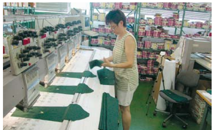
Lärmmessung (hinten rechts auf Stativ) beim Besticken von Krawatten bei Männel.

„Das Tückische an Lärm ist, dass man Schäden am