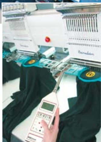
Deutliche Unterschiede von bis zu 5 dB gibt es bei älteren und neuen Maschinen, gemessen in der Stickerei Daum.

Die Form und Ausprägung des perfekten Gehörschützers wird im wesentlichen durch Lärmintensität, Tragedauer und Tragekomfort bestimmt. Kapselgehörschützer sind bei hohen Schallpegeln über 120 dB die beste Lösung. Einweggehörschützer (auch Gehörschutzstöpsel genannt) und Bügelgehörschützer sind für niedrigere Schallpegel ausreichend. Sie werden im Gehörgang oder in der Ohrmulde am Eingang des Gehörganges